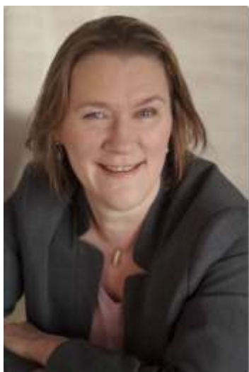
Van de redactie

Vrijdag 18 mei jl. hebben we weer vergaderd. Elke keer voordat een nummer verschijnt, proberen we bij elkaar te komen. Ditmaal was het eigenlijk een moeilijke vergadering, want we hadden het over de toekomst van Haghespel. En ik spring meteen naar de uitslag, want ik ga u vertellen dat we hebben besloten te stoppen met dit mooie blad. De nummers voor de zomer maken we nog af, maar daarna is het voor ons als redactie definitief over.